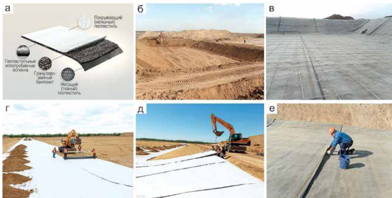
Рис. 4. Схема строения бентомата (а), примеры его применения для создания изоляции мест хранения бытовых отходов (до укладки геотекстиля (б), после укладки геотекстиля (в)) и примеры укладки (г, д) и ручного монтажа (е) геотекстиля при создании противодиффузионных барьеров.

почву и грунтовые воды загрязняющих веществ, а также защиты строительных конструкций от воздействия влаги. Принцип действия основан на свойстве монтмориллонита активно увеличиваться в объеме при гидратации. В ограниченном пространстве при гидратации частицы монтмориллонита образуют макромолекулярную структуру с характеристиками твердого тела — гель, обладающий низкой водопроницаемостью, упругостью и пластичностью. Бентонитовый мат представляет собой гибкий и прочный иллопробивной каркас из полипропиленовых волокон, внутри которого равномерно расположены гранулы натриевого бентонита.