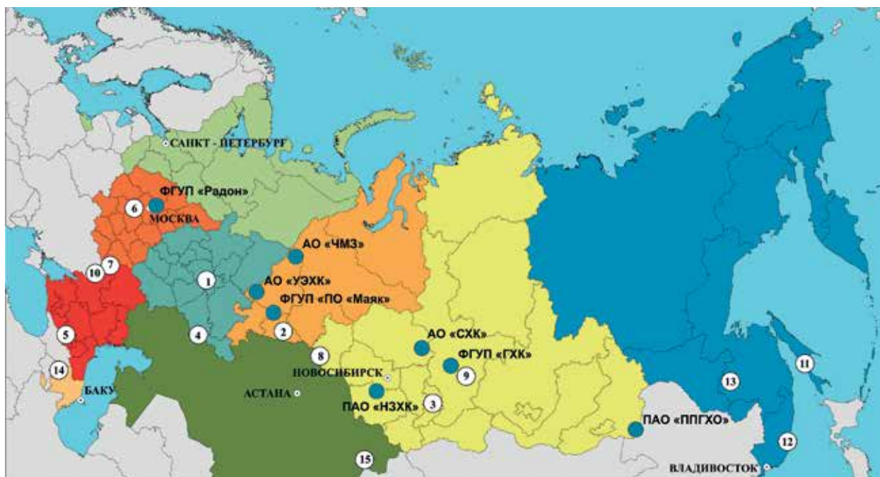
Рис. 2. Обзорная карта минерально-сырьевой базы бентонитовых глин РФ и некоторых стран СНГ. Список месторождений: 1 – Биклянское, Березовское и др. (Татарстан); 2 – Зырянское (Курганская обл.); 3 – 10-й Хутор (Хакасия); 4 – Ижбердинское, Сарайбашское и др. (Оренбургская обл.); 5 – Герпегежское, Нальчинское (Кабардино-Балкария); 6 – Калиново-Дашковское (Московская обл.); 7 – Никольское, Майдан-Бентонитовое, Подгорное (Воронежская обл.); 8 – Любинское (Омская обл.); 9 – Камалинское (Красноярский край); 10 – Тарасовское, Миллеровское (Ростовская обл.); 11 – Тихменевское, Вахрушевское, Макаровское (Сахалинская обл.); 12 – Зеркальное (Приморский край); 13 – Ургальское (Хабаровский край); 14 – Даш-Салахлинское (Республика Азербайджан); 15 – Таганское, Динозавровое (Республика Казахстан)

структурными особенностями основного полезного компонента — монтмориллонита [20]. Содержание монтмориллонита может варьировать в бентонитовых глинах от 65% (месторожд. Зырянское) до 75–80% (месторожд. 10-й Хутор и Даш-Салахлинское) и даже до 98% (отдельные рудопоявления месторожд.). Бентонитовое сырье добывается на карьерах селективно, что позволяет получать продукты с задаваемым качеством. На рис. 2 приведена карта с расположением основных месторождений, разведанных в настоящее время на территории РФ и стран СНГ [21–26]. Таким образом, можно с уверенностью утверждать, что запасов бентонитового сырья разного качества на рынке РФ с избытком хватит для решения всех вопросов по обращению с РАО.