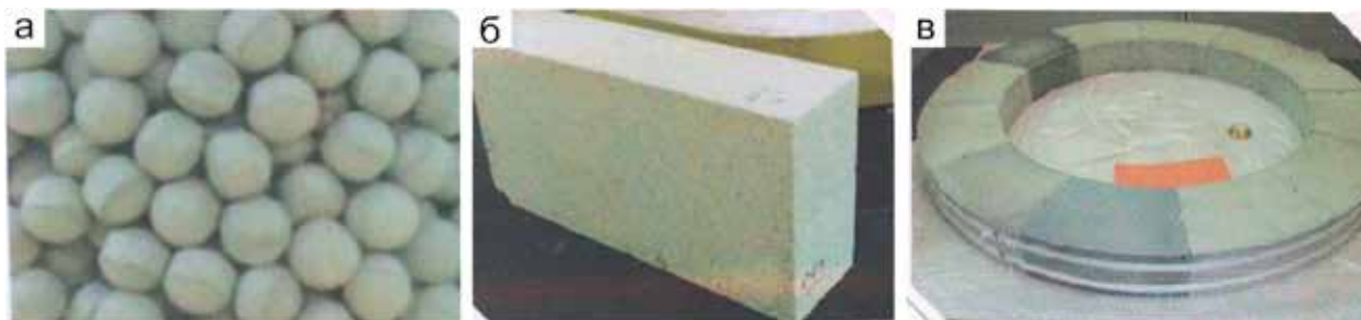
Рис. 3. Примеры продукции, производимой на основе бентонитовых глин и бентонитовых глин с песком